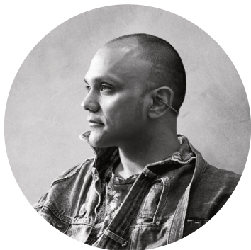
↑ Gaurav Gupta

L'Inde a beau être désormais le pays le plus peuplé de la planète et le nouvel eldorado économique, elle ne bénéficie pas pour autant du statut de grande nation de la mode. À la fois usine pour la planète et berceau de traditions artisanales séculaires, on y a rarement cultivé la notion de "créateur". Et, lorsque celle-ci est admise, la prévalence de Bollywood a soumis cette fonction à un genre et aux clichés qui en découlent. Le gigantisme du marché intérieur, l'importance du calendrier festif indien et la rareté du retail multimarque ont conduit l'Inde à une sorte d'insularité dont seule une poignée de privilégiés peuvent s'échapper. Cette projection culturelle et stylistique de l'Inde à l'international semble désormais passer par la couture et donc par le calendrier parisien. Gaurav Gupta est le plus habile et le plus flamboyant de ces disrupteurs. Après ses études à l'incontournable Central Saint Martins de Londres, il peaufine son apprentissage auprès de Hussein Chalayan et fonde sa marque en 2005. Ce Mumbaïkar marque immédiatement les esprits en s'éloignant des poncifs précités avec ses créations